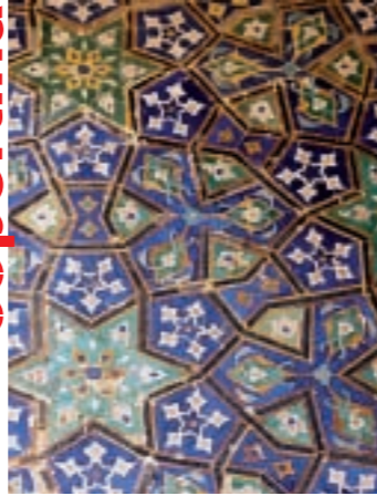
Immagine di copertina: Simmetria a Samarcanda di Annamaria Sautter