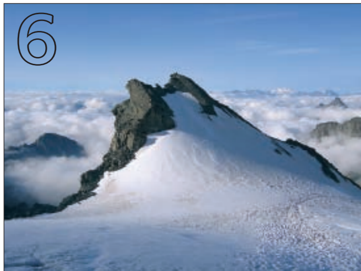
Grande Ghiacciaio di Verra