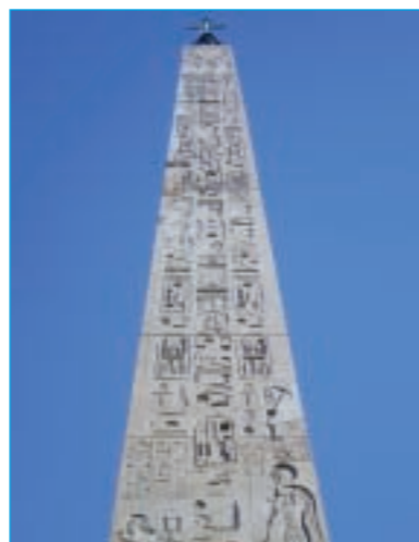
Immagine di copertina di: Cyberian8, www.flickr.com