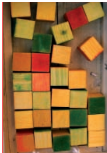
Exhibit realizzato dalla classe ID dell'I.C. di Bernareggio nell'ambito di MeJ 2010/11