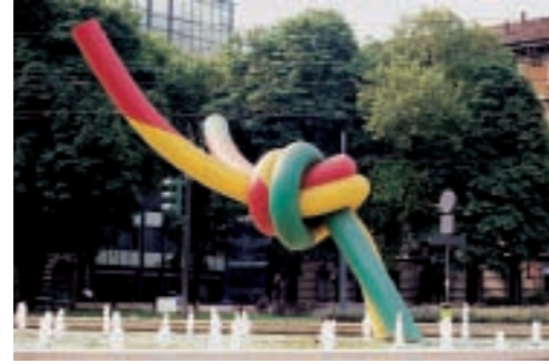
Immagine di copertina: Il nodo di piazzale Cadorna a Milano di Sabrina Provenzi