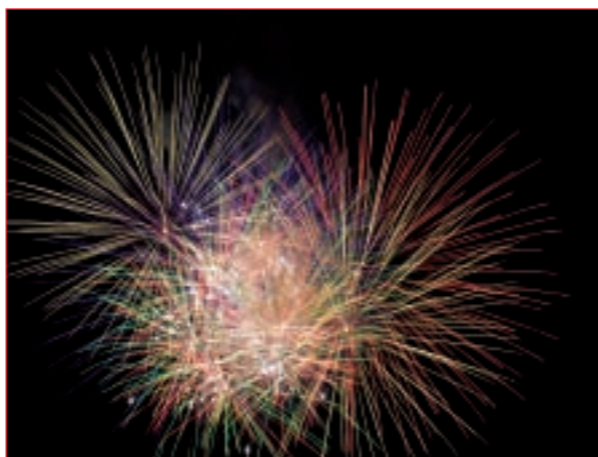
Immagine di copertina: