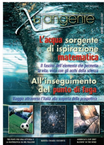
Immagine di copertina: Water vortex, Aldas Kivaitis