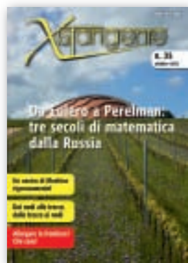
Immagine di copertina: Il Carapace della tenuta Castelbuono